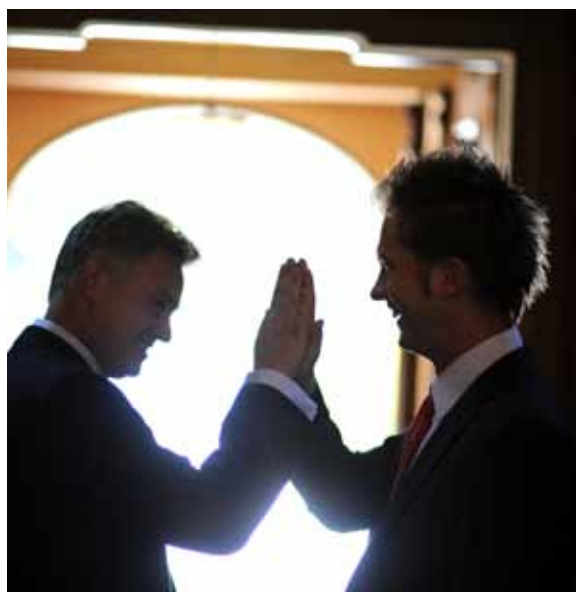
COLLABORATION, ALLIANCES, M&A 提携、統合、M&A