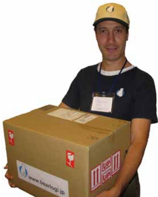
BEAR LOGI IS A REGIONAL PROVIDER OF LOGISTICS REAL ESTATE SOLUTIONS ベアロジは地域に焦点をおく物流不動産会社です。